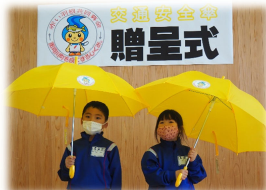
▲ 新入学児童への交通安全傘配付