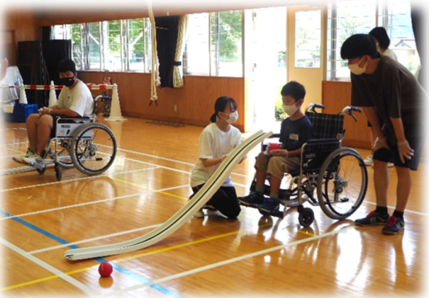
◀ 小学生ボランティアサマースクール （ポッチャ体験、馬頭高校ボランティア部との連携）