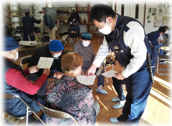
◀ 小砂地区サロンにおける特殊詐欺防止講座 （生活支援コーディネーター、警察署と連携した活動）