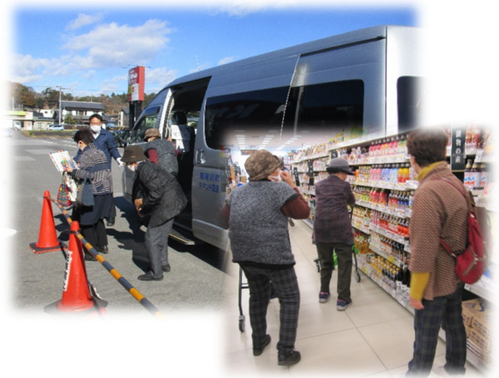
▲ デマンドタクシーを利用した買い物支援ツアー