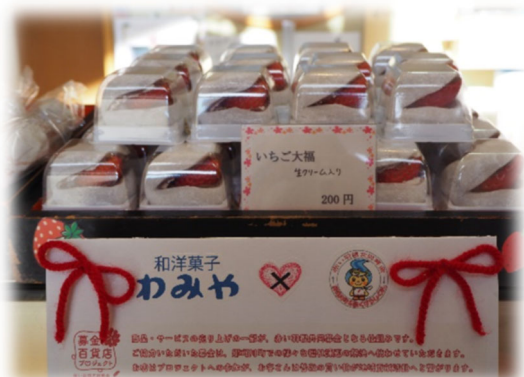
▲ 町内事業者協力による募金百貨店プロジェクト