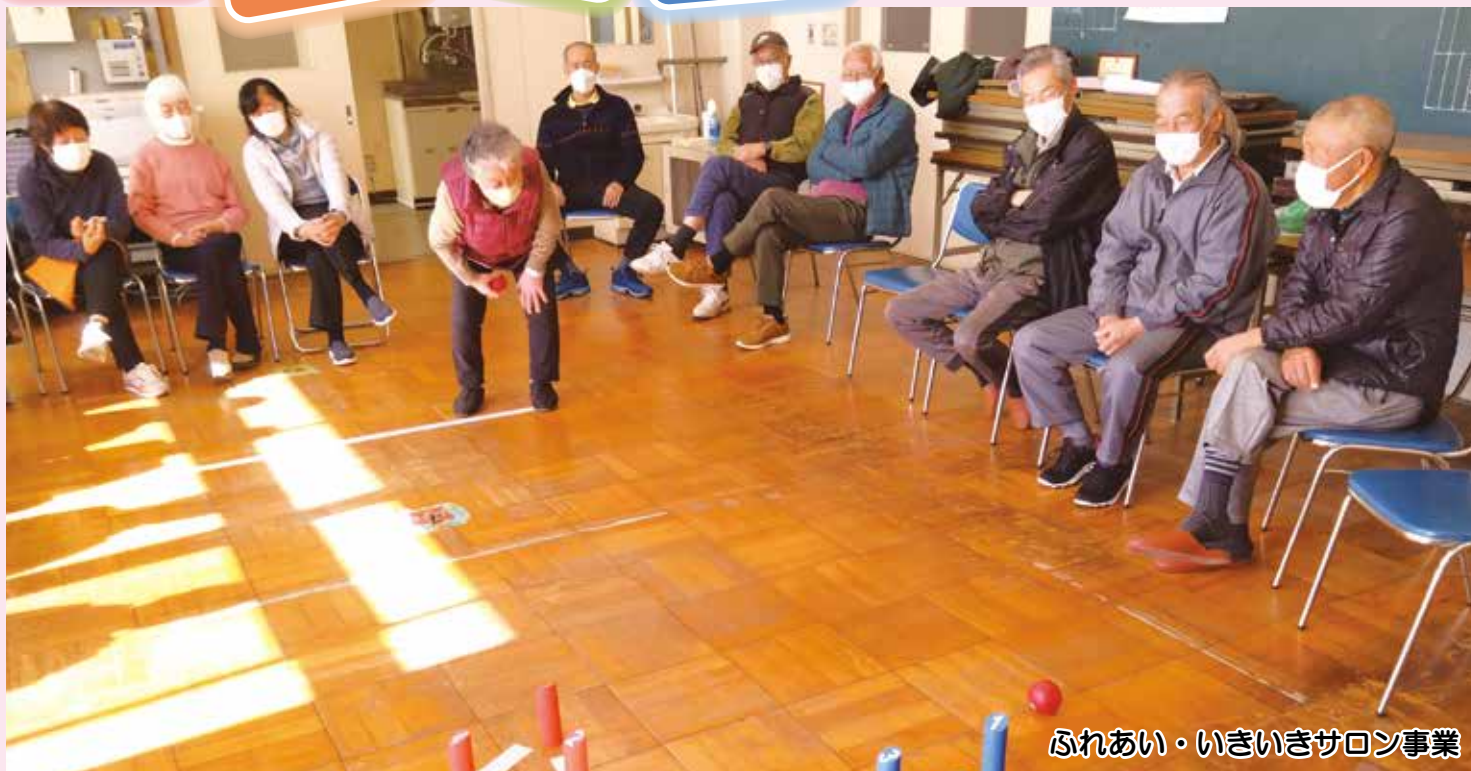
ふれあい・いきいきサロン事業