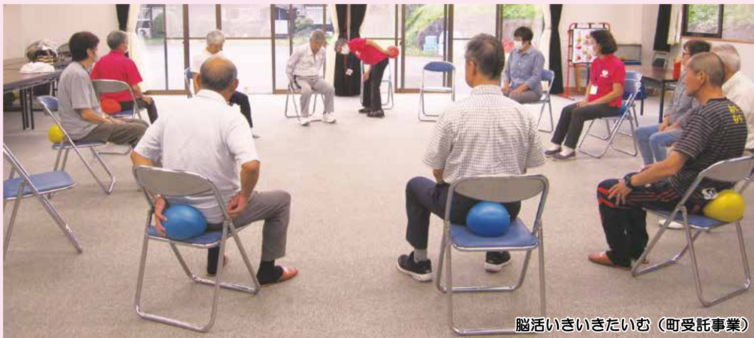
脳活いきいきたいむ（町受託事業）